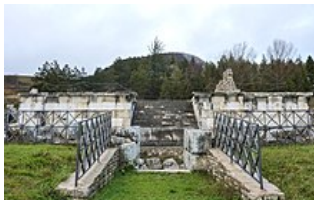
Anfiteatro di Larino - Ricostruzione del 1740 (a SX) - Tempio Sannita di Pietrabbondante (a DX)