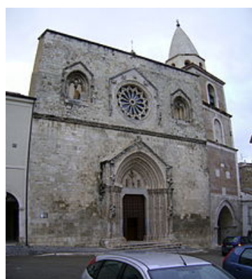
Colonne della Basilica del municipio romano di Saepinum (a SX) - Facciata del Duomo di Larino ( a DX)

Inoltre, questa consente di mettere in connessione i singoli elementi che compongono il territorio in cui si vive rintracciando reciproche influenze ( competenza in materia di consapevolezza ed espressione culturale ). Il patrimonio artistico-culturale della regione insieme alle attività legate al turismo rappresentano spesso reali opportunità di lavoro per gli studenti del Cpia che ravvisano perciò la necessità di potenziare le competenze comunicative e linguistiche per meglio integrarsi nel contesto in cui vivono. Inoltre sul territorio della provincia di Campobasso sono presenti L'Università degli studi del Molise fondata nel1982 ( con sede centrale a Campobasso e sedi periferiche a Termoli e Pesce ), L'Università degli Studi Di Roma " La Sapienza " presente sul territorio regionale con il Polo Didattico del Molise e L'università Cattolica del Sacro Cuore presente con il presidio ospedaliero specialistico Gemelli Molise a Campobasso. Appartengono alla provincia di Campobasso 44 scuole secondarie di secondo grado e 62 strutture nella categoria di scuola secondaria di primo grado con cui attivare Raccordi di reti e collaborazioni. Il Cpia in quanto Rete territoriale di servizio svolge anche attività di Ricerca, Sperimentazione & Sviluppo in materia di istruzione per adulti e interventi